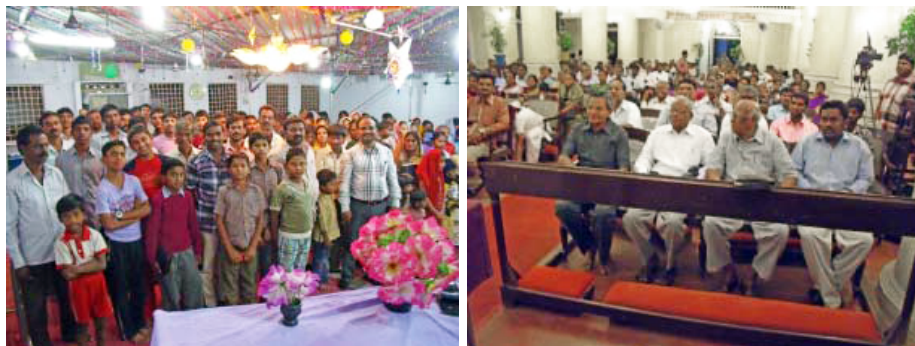
Deux photos avec les frères et soeurs de l'Inde

Si vous êtes intéressés à recevoir nos brochures, vous pouvez nous écrire à l'adresse suivante :