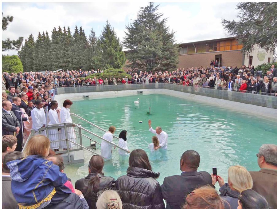
Une photo du 3 juin 2012. Depuis les années 60, nous avons pu baptiser bibliquement au Nom du Seigneur Jésus-Christ plusieurs milliers de croyants.