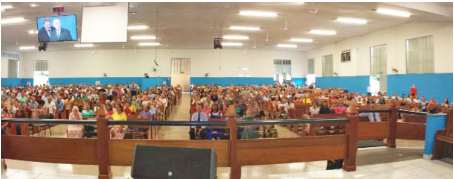
Goiania, au Brésil, le 15 novembre 2015