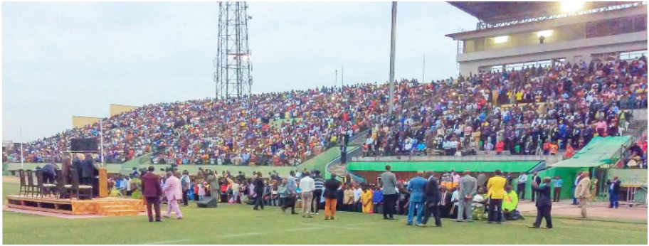
Kinshasa, République démocratique du Congo, le 1 er juillet 2015

„... Je t'établis pour être la lumière des nations, pour porter mon salut jusqu'aux extrémités de la terre“ (És. 49:6).