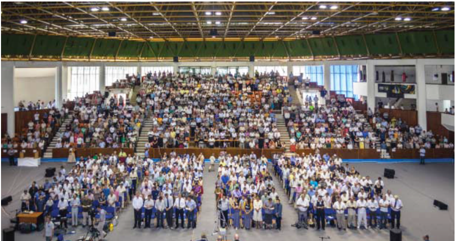
Targu Mures, en Roumanie, le 15 août 2015