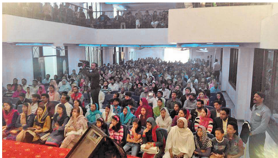
La photo montre la deuxième réunion dans une église à Lahore, Pakistan.