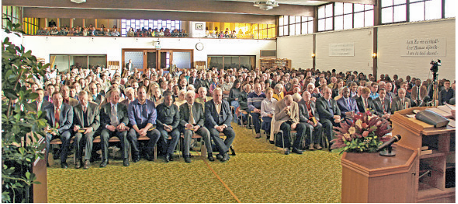
La réunion du 4 décembre 2016 au Centre missionnaire de Krefeld

Bien-aimé Seigneur, souviens-Toi de l'Alliance que Tu as faite avec nous, du Sang que Tu as versé pour nous, des promesses que Tu nous as données et par Ta grâce, accorde à Tes héritiers Ta vie éternelle.